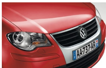
Rouge Cerise* Peinture métallisée 2K