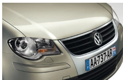
Feuille d'Argent* Peinture métallisée 7B