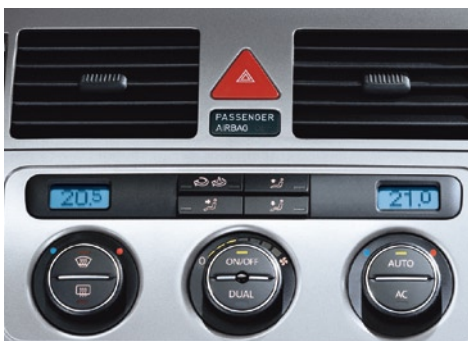
Climatisation automatique "Climatronic" à réglage bi-zone.

Pour le côté pratique, vous bénéficierez d'une climatisation bi-zone réglant automatiquement la température de façon optimale, d'un siège passager avant rabattable qui peut servir de table ou faciliter le chargement d'objets longs sur toute la longueur de l'habitacle, d'un accoudoir central avant réglable aussi bien en hauteur qu'en longueur et de multiples rangements (jusqu'à 39). Vide-poches, porte-boisson, porte-bouteille, tablettes, tiroirs, trappes et aumônières sont largement disséminés dans l'habitacle, à l'avant comme à l'arrière, au plafond comme sous les pieds des passagers. Une radio CD MP3 avec prise auxiliaire pour connecter un baladeur et écouter votre musique via les 8 haut-parleurs du Touran Freestyle, répond elle aussi présente. Bien entendu, les vitres avant et arrière électriques font partie de la dotation de série, de même que le réglage d'appui lombaire des sièges avant confort. Comme vous pouvez le constater, le Touran Freestyle se plie en quatre pour vous satisfaire visuellement comme intrinsèquement.