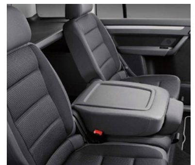
Siège central de la 2 e rangée rabattable avec fonction table.