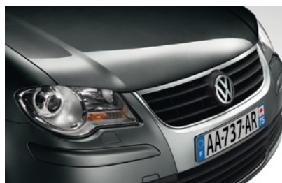
Noir Intense* Peinture nacrée 2T