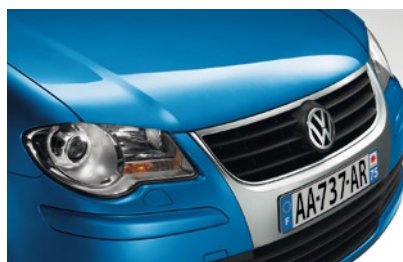
Bleu Biscay* Peinture nacrée 7Q