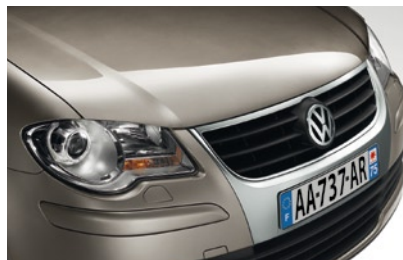
Gris Ardoise* Peinture métallisée X9