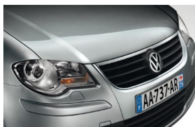
Gris Mountain* Peinture métallisée Z3