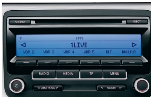
Radio "RCD 310" : Lecteur CD intégré en façade, lecture des formats audio MP3 et WMA, avec affichage des plages, connexion auxiliaire 'AUX-IN' dans l'accoudoir central avant, permettant de brancher un baladeur et d'écouter votre musique via les haut-parleurs du véhicule, ajustement automatique du volume en fonction de la vitesse GALA, puissance de sortie 4 x 20 W sur 8 haut-parleurs.