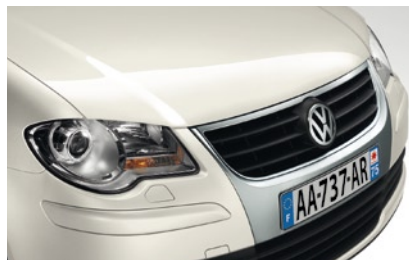
Blanc Candy Peinture unie B4

Le Touran Freestyle vous offre un large choix de couleurs et de nuances afin de vous permettre d'exprimer librement votre personnalité et de choisir un véhicule correspondant précisément à vos attentes et vos goûts.