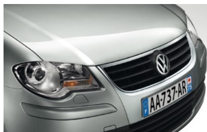
Reflot d'Argent* Peinture métallisée 8E